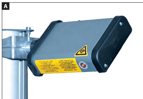
Puntatore laser per allineamento longitudinale.